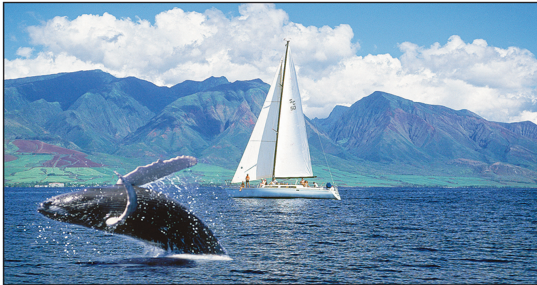
MARE E NATURA II «Santuario dei Cetacei», nel Mar Ligure, è un'area protetta in cui è possibile osservare liberamente balene e delfini di varie famiglie

nazionale e altri interventi di elevato livello scientifico hanno contribuito, seppure lentamente, al superamento di difficoltà burocratiche e politiche. Infine l'attuale successo. Ovviamente i biologi del mare dovranno affrontare altre ricerche complesse, perché questo genere di studi non si pone traguardi da raggiungere ma un arricchimento della conoscenza, calibrandola sul mutare continuo delle condizioni ambientali. Tuttavia il Santuario è oggi una realtà ammirata a livello inter-